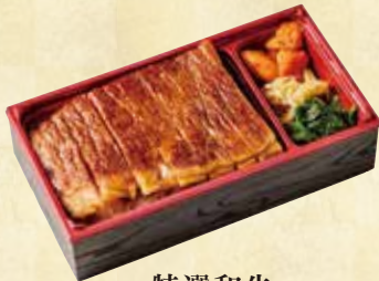
特選和牛 ステーキ弁当

静岡県のブランド和牛『特選和牛静岡そだち』とブランド豚『金豚王』を使用 静岡県産米「にこまる」と合わせたお弁当です