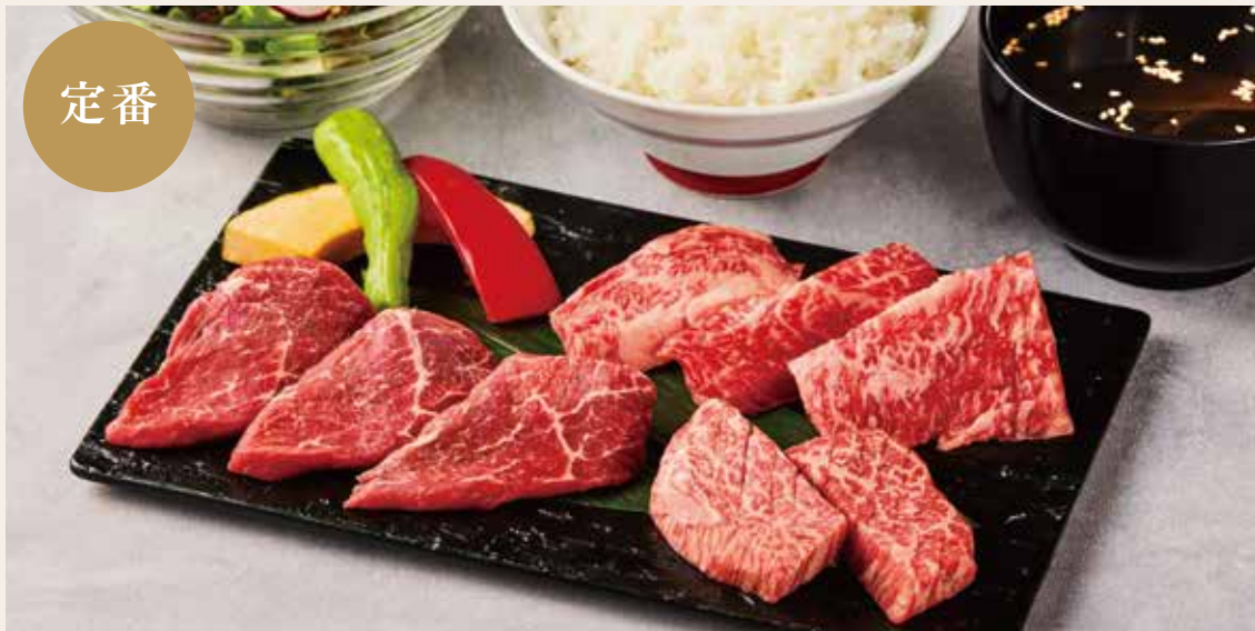
そだち焼肉ランチ (特選和牛3種)