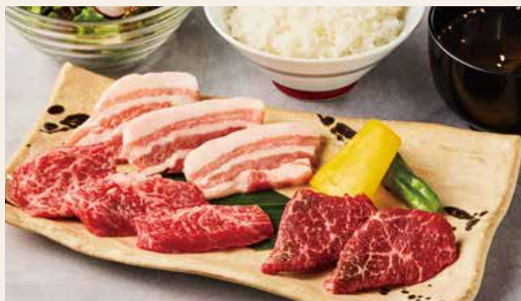
おすすめ焼肉ランチ (特選和牛2種・豚)