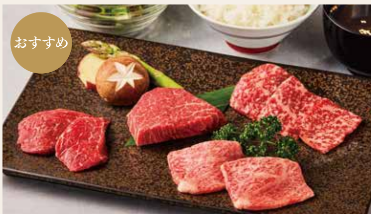
上焼肉ランチ (特選和牛4種)