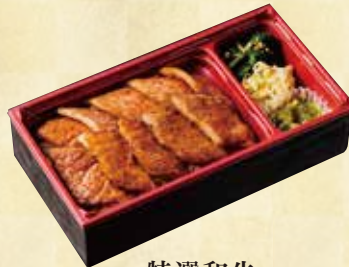
特選和牛 焼肉弁当