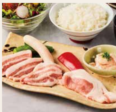
金豚王 焼肉ランチ