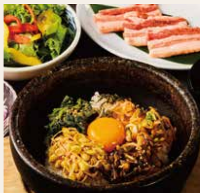
石焼ビビンバ& 金豚王焼肉ランチ