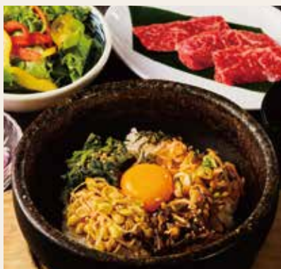
石焼ビビンバ& 特選和牛焼肉ランチ